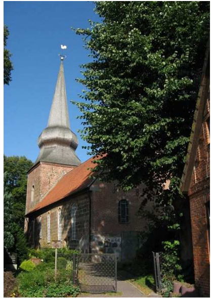
Cappel – Ev. Kirche Sankt Petri und Sankt Paul

Door de eerste 15 aangemelde spelende organisten kan gespeeld worden in Norden, Altenbruch, Cappel en Dornum.